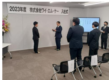
■社長橋戸より新入社員3名に辞令交付。

4月3日より新年度がスタートしました。新社屋で初めての入社式を執り行いました。今年度の新しい仲間が3名です。社長の御言葉で身が引き締め、先輩の言葉で少し安心して、終始朗らかな雰囲気の中で行うことができました。