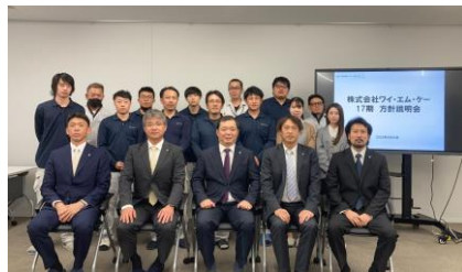
■17期いざスタート!! 集合写真