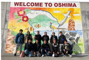
■初日の伊豆大島大自然グループ

2日目は遅めの出発にして朝食ビュッフェを楽しみ箱根に寄って帰ってきました。久々の社員旅行に行けたことに感謝しつつ、必ず来年も旅行が出来るよう頑張ろう、と誓う社員一同でした。