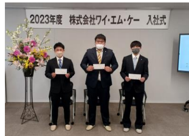
■17期の新入社員3名です。よろしく願っています。