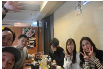
■初日の熱海散策グループ