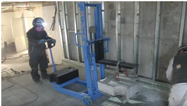
■電気カッター、ウォールソーで切断したスラブをパワーリフトにて搬出中

今回、手動式のパワーリフターを導入しました。本機械は、建物内部のスラブ切断後の撤去作業に役立つものとなります。今までは、三脚か天井アンカーを打設して、チェーンで引き上げて、ハンドリフト等で運んでおりましたが、この機械を使用する事で2工程だった作業が、1工程で出来るようになりました。また、改修工事の場合、搬入口に制限がありますがこのリフターなら小スペースで撤去作業を行うことが出来ます。弊社導入機械は、300kgまで吊上げ可能です。今後各現場にて活躍していきますので、宜しくお願い致します。