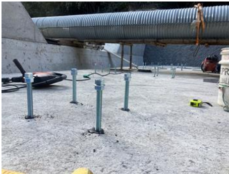
■カプセル式ケミカルアンカーを丁寧に打設しました

某砂防工事にて流木止め鋼製スリットを据え付ける為のケミカルアンカー工事に行ってきました。ボルトに対してベースプレートの穴が1mmしか余裕が無い為、繊細な施工を要求される内容でしたが、ワイ・エム・ケーは綺麗に丁寧に、資格者（あと施工アンカー1種）がしっかりと施工してきました。