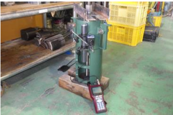
■大型引張試験機と変位計測器の設置状況

ワイ・エム・ケーではD51まで対応できる大型引張試験機を所有し各地で引張試験の対応を行っておりますが、大型機械に対応する変位計を所有しておりませんでした。