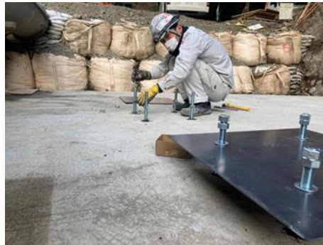
■ベースプレートの設置を行っています

今回は、砂防工事の流木止め鋼製スリットを据える為のケミカルアンカー工事を行いました。砂防工事では切断工事も行っております。流木止めを設置する場所を作る為の切断工であるワイヤーソー、古い躯体を取り壊すための静的破砕（バースター工法）等も施工できますので、何なりとお申し付けください。