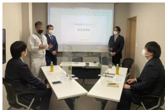
■午前中は会議室で事業説明を聞いてもらいます

2022年3月に来年度新卒者を対象にした会社説明会を行いました。希望参加者は大学3年生5名。コロナ感染防止を考慮し3日間の日程を組み、1名~2名/日の少人数で開催しました。今年も午前中は、スライドを使用しながら事業紹介と事例クイズを交えた参加型の説明で進めていきました。