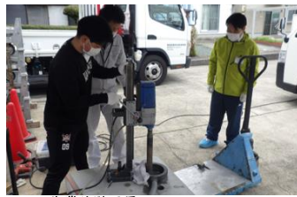
■コア作業体験風景